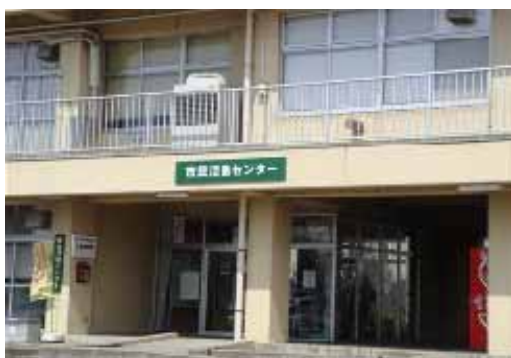
NPO法人茨城県南生活者ネットが運営事業を行う市民活動センター