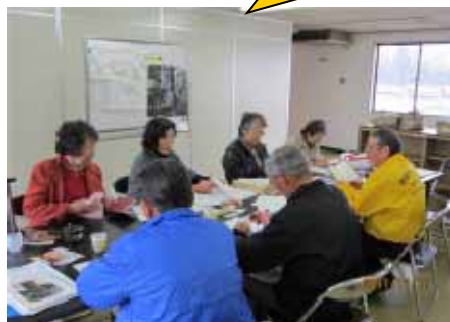
お宝の木発掘委員会の活動の様子