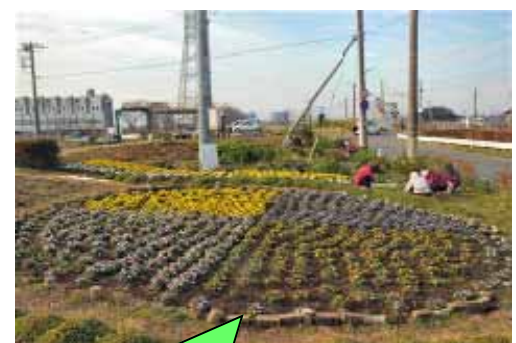
小貝川・花とふれあいの輪の活動の様子