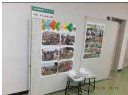
小貝川・花とふれあいの輪