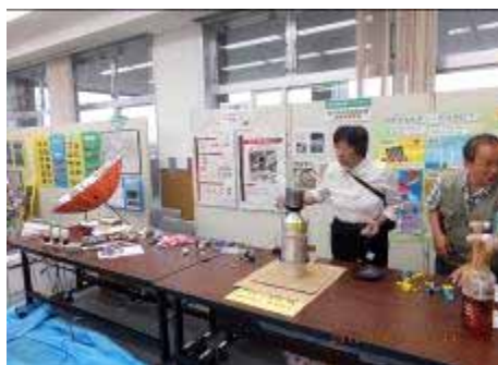
市民環境会議・環境学習部会