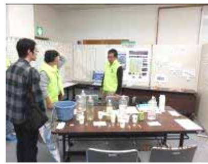
市民環境会議・水・大気環境部会