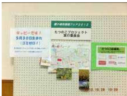
たつのこプロジェクト実行委員会