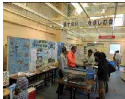
龍ヶ崎の水辺を親しむ会