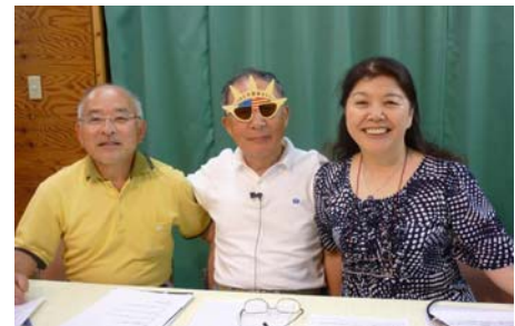
公園の里親 のぼさんクラブ (自由のメガネ?)