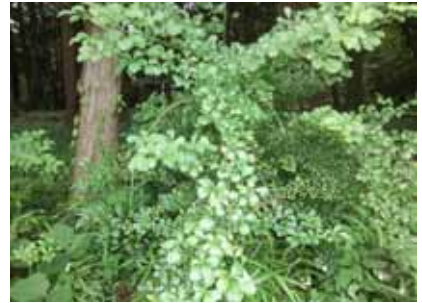
ウコギ(腰痛・強精)