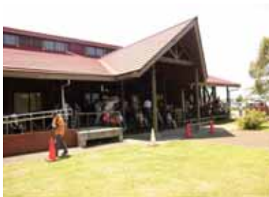
ふるさとふれあい公園で休憩