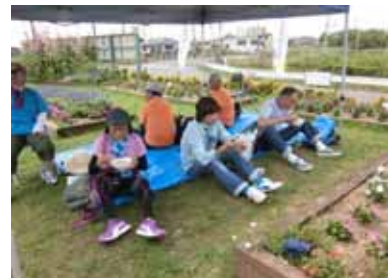
終わった後の豚汁がたまりませ～ん！