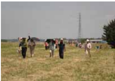
小貝川の土手を元気に歩きます