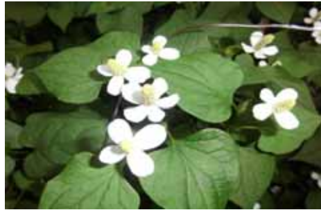
ドクダミ(排毒・利尿・便秘)